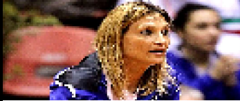
ITALIA-TAIPEI, GARBIN "PUBBLICO VALORE AGGIUNTO"