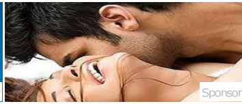
Sarà felicissima! Potenza sempre affidabile a ogni età.