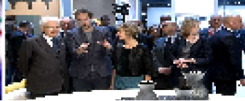
SALONE DEL MOBILE, MATTARELLA INAUGURA LA 56ª EDIZIONE