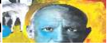
PICASSO, INIZIATIVE PER CENTO ANNI DAL VIAGGIO IN ITALIA