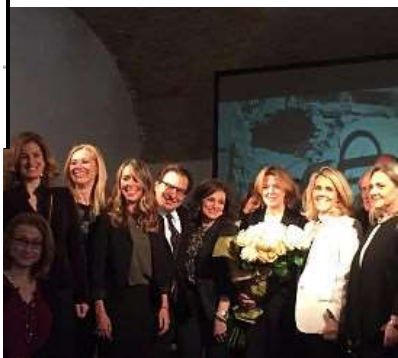
Palermo. i 110 anni della Clinica Candela