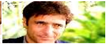
GIANNINI E FRASSICA IN "IL CORAGGIO DI VINCERE" SU RAI1