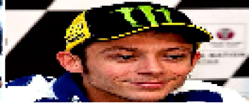
ROSSI "IN ARGENTINA ANCORA PER IL PODIO"