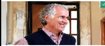
MALAGÒ "SIAMO VIGILI E ATTENTI SULLE FEDERAZIONI"