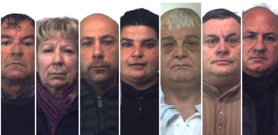
"Per 110 euro ho buttato ... PALERMO: nomi e ruoli di chi è finito sotto accusa. Così organizzavano le truffe...