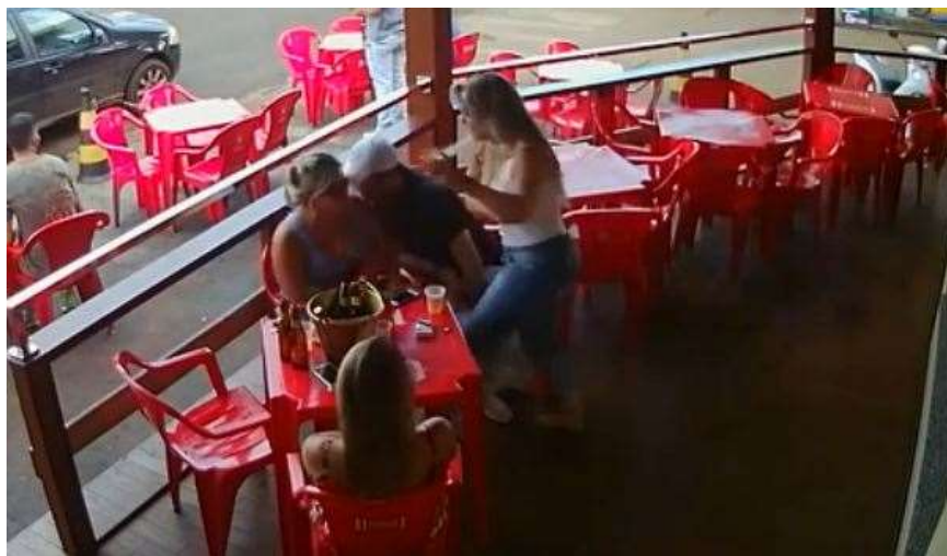
Scopre marito e amante al... LA RISSA: la rissa poi dilaga e diventa infinita.