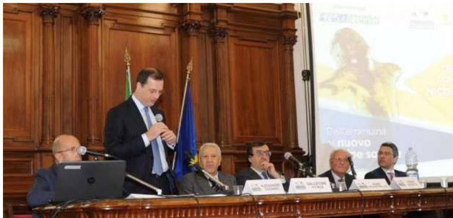
Il presidente dell'Istituto: "Siamo uno strumento al servizio delle aziende siciliane".