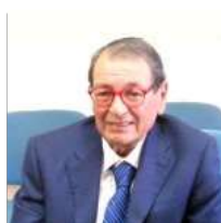
Popolare Sant'Angelo: utile netto di 6,2 mln, dividendo di 70 centesimi