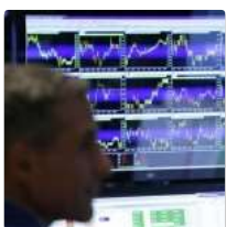
Banche, Abi: sofferenze nette a gennaio in calo a 83,6 miliardi