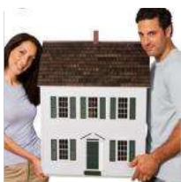
Banche, Abi: nuovi mutui per abitazioni +97,4% nei primi 11 mesi