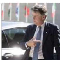
Banche, Ue: venduti prodotti inadeguati a persone forse ignorare